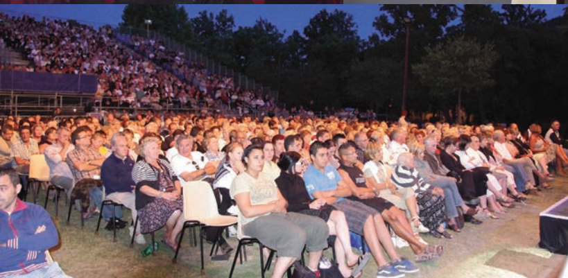
SOIRÉES LYRIQUES GLORIANA