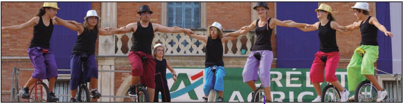
L'école de cirque des Pitrieres