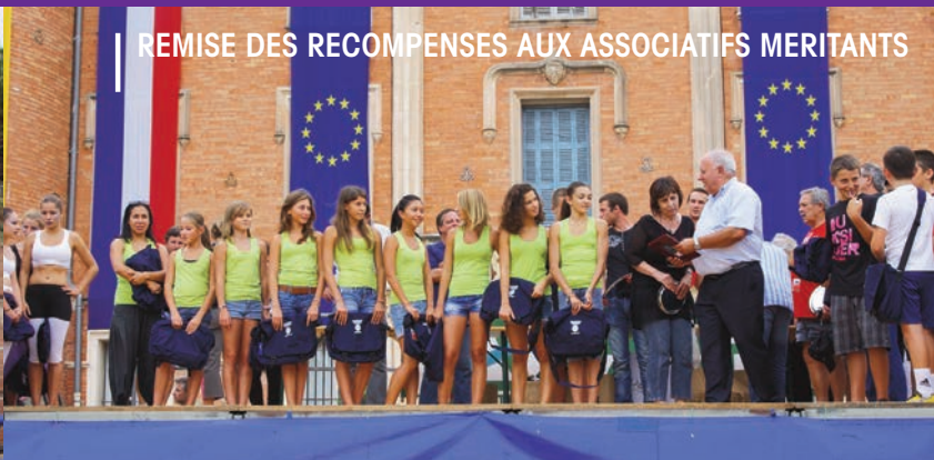
REMISE DES RECOMPENSES AUX ASSOCIATIFS MERITANTS