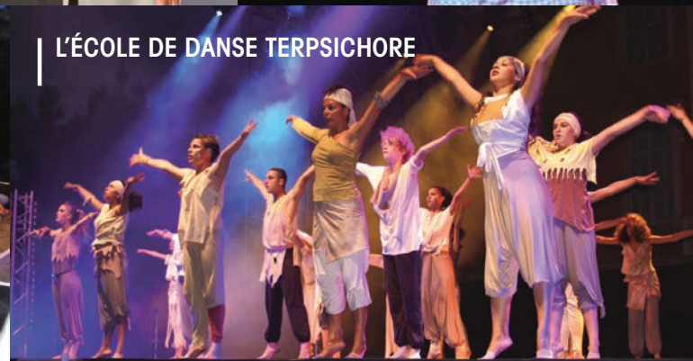
L'ÉCOLE DE DANSE TERPSICHORE