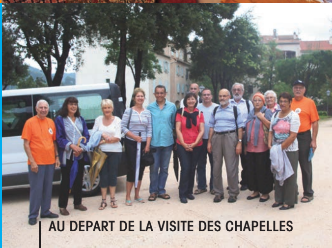
AU DEPART DE LA VISITE DES CHAPELLES