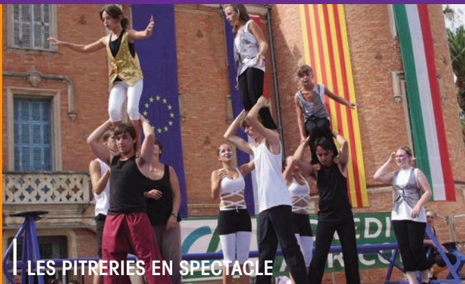
LES PITRERIES EN SPECTACLE