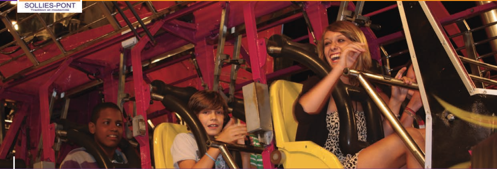
FÊTE FORAINE DE LA SAINTE CHRISTINE PAR LE COMITÉ DES FÊTES