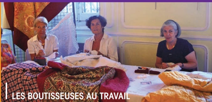
LES BOUTISSEUSES AU TRAVAIL

Retrouvez en direct les reportages photographiques des événements locaux sur le site de la ville