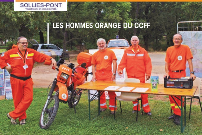
LES HOMMES ORANGE DU CCFF