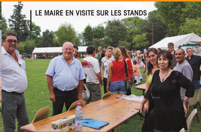
LE MAIRE EN VISITE SUR LES STANDS